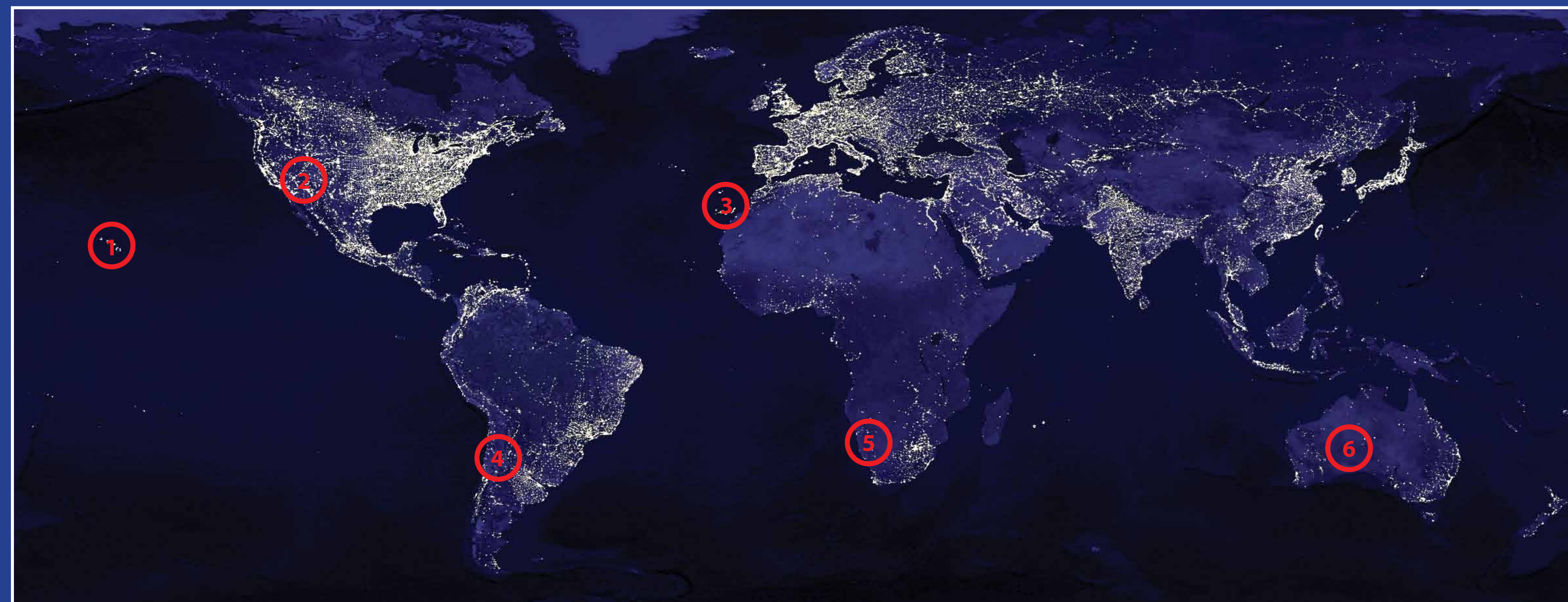
Satelitní snímek Země v noci. Nejhorší situace z hlediska tmavé oblohy je v Evropě, Japonsku a ve východní části USA. Naopak nejlepší místa s nejtmavší oblohou a vysokým počtem jasných nocí, kde se budují největší pozemské observatoře, jsou na jižní polokouli pouště v Chile (4), Namibii (5) a Austrálii (6). Na severní polokouli jsou vhodné lokality pro umístění velkých teleskopů Kanárské (3) či Havajské ostrovy (1) a také pouštní oblasti na západě USA (2).

Menschen begehren seit Ewigkeit danach, sich selbst unter den Sternen zu finden und verlieren. So, wie andere Organismen benutzte Mensch die Sterne zur Navigation in ferne Länder und für den Weg nach Hause. Im Blick auf den Himmel mit Tausenden von Sternen sieht man das wahre Ich, den wahren Grund der menschlichen Existenz. Auch die in Städten lebenden Menschen möchten manchmal dieses Gefühl erleben, „sich unter den Sternen zu verlieren“. Ihre Sehnsucht kann leider nicht erfüllt werden, denn am beleuchteten Stadthimmel sieht man fast keine Sterne und die Milchstraße ist an stadtnahliegenden Orten nicht gerade atemberaubend.