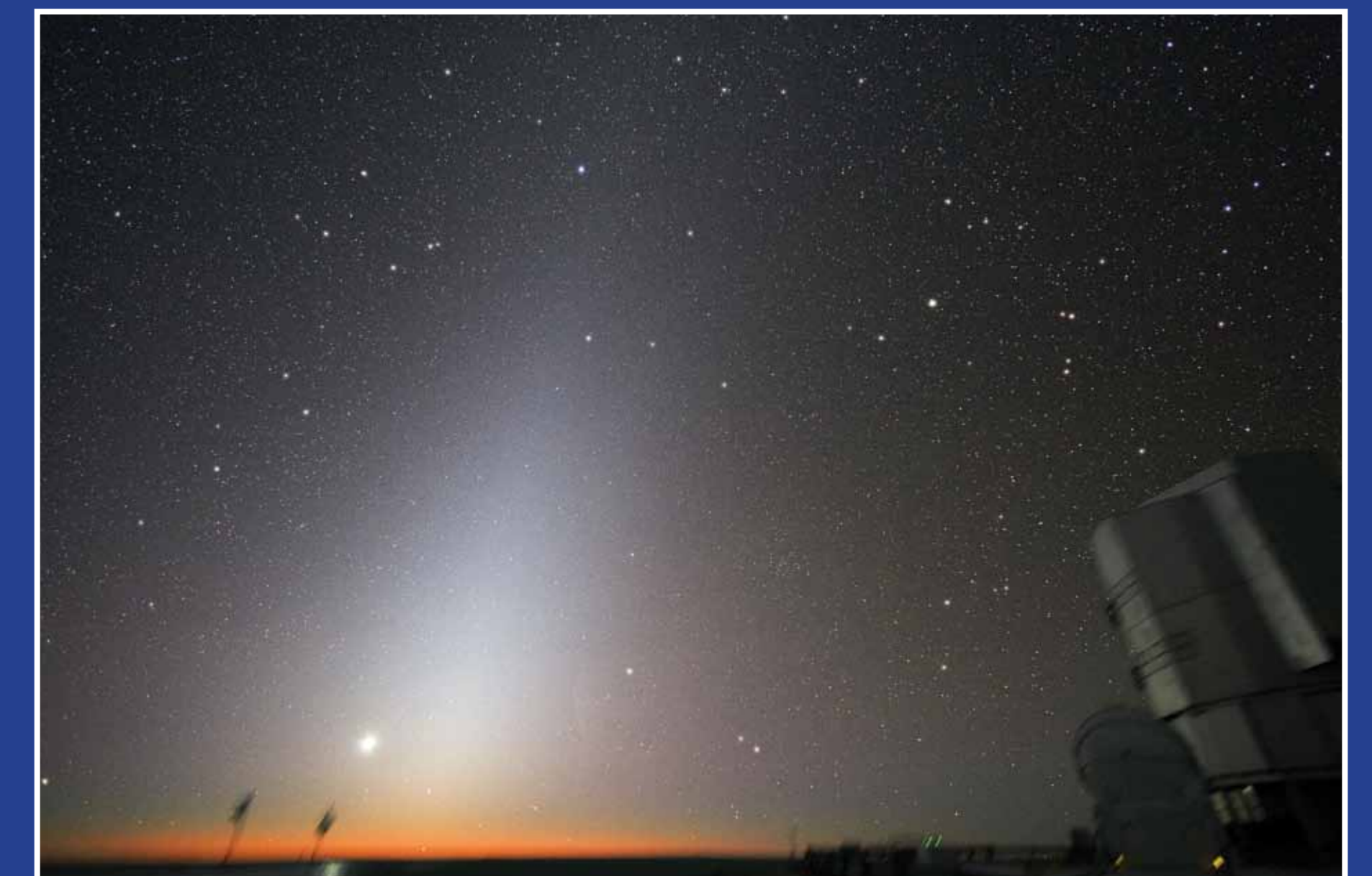
Zvířetníkové světlo je jedním z kritérií kvalitní tmavé oblohy. Na městské obloze se ztrácí v přímíře světla.

Es werden weltweit Schutzgebiete und Parks gegründet, die nicht nur Natur, sondern auch den dunklen Himmel schützen sollen. Sie werden gegründet, um die Aufmerksamkeit auf eine ständig abnehmende Zahl der Orte mit dunklem Himmel zu richten, um die internationalen Observatorien vor einer Lichtverschmutzung zu schützen und um das Kulturerbe unserer Vorfahren zu erhalten, die sich am Himmel viel besser als wir orientieren konnten und die im Einklang mit Natur lebten. Sie befinden sich gerade an einem solchen Schutzort. Im Isergebirge hat der Dunkelhimmelschutz leider keine rechtliche Grundlage, jedoch gibt es echte Schutzgebiete des dunklen Himmels, wo Dunkelheit gesetzlich geschützt wird. Die meisten gesetzlichen Schutzgebiete sind in Nordamerika, wo die Internationale Organisation für einen dunklen Himmel am längsten agiert. Im nach hinein wurden ähnliche Parks auch außerhalb von USA und Kanada gegründet, um die Öffentlichkeit zu informieren und um ihr die Schönheit des Nachthimmels zu zeigen. An solchen Standorten ist oft nicht der wahre natürliche Himmel zu sehen, trotzdem kann man so viele Sterne beobachten, dass man in ihnen ertrinken kann. Der Weg wird alleine durch die Milchstraße beleuchtet, und das ist die Existenzidee von solchen Parks und Schutzgebieten, auch des unseren.