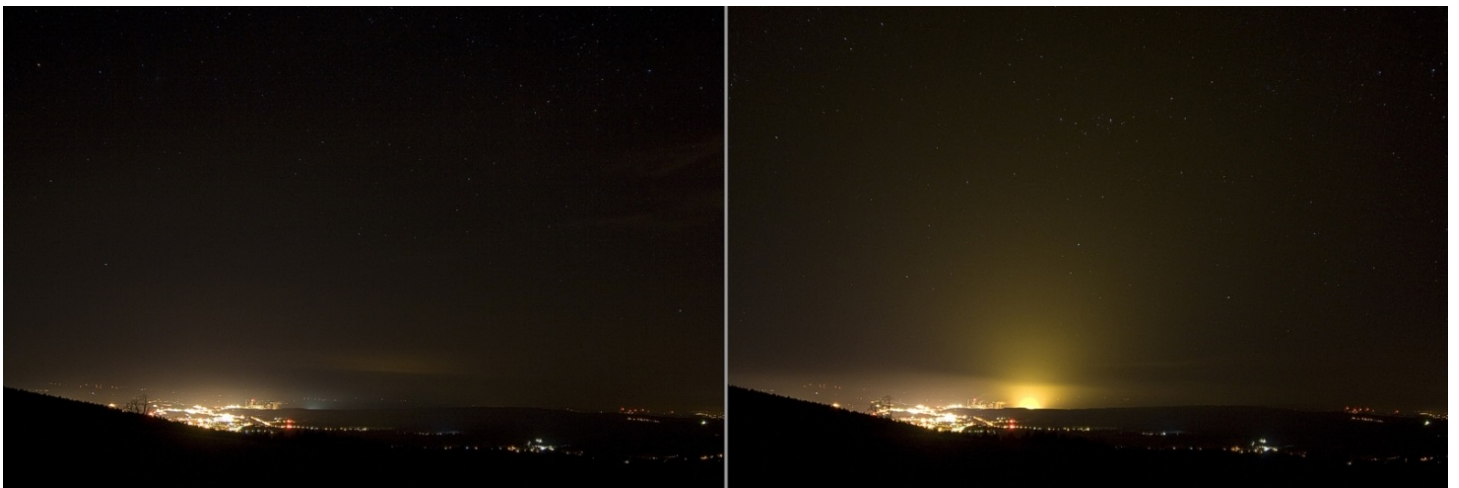
Widok w kierunku Bogatyni i szklarni ze wzgórza odległego o 12 km od szklarni. Dwa zdjęcia porównują sytuację, w której oświetlenie w szklarni jest włączone i wyłączone.